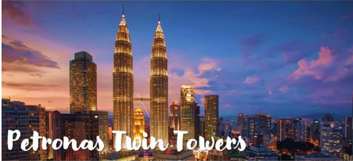
Petronas Twin Towers

東南アジアの中心に位置するマレーシア。マレー系、中華系、インド系の三大民族をはじめ、多数の先住民族が互いの文化や習慣を尊重し合い、共に暮らしています。そんなマレーシアの首都である「クアラルンプール(通称KL)」の魅力を、新居浜市で働いているマレーシア出身の国際交流員、ファラがご紹介します！