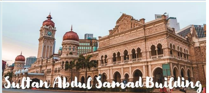
Sultan Abdul Samad Building

例年行われる独立記念日のパレードのバックドロップとなり、KLのランドマーク的存在の一つです。