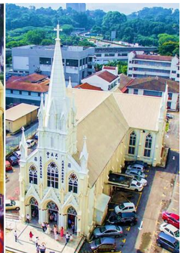
Holy Rosary Church

約4億年かけて形成された「バトゥ洞窟」。272段の階段を登った先には、ヒンドゥー教の聖地となる寺院があります。インスタ映えする虹色の階段は、若い女子に人気！