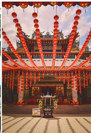
Thean Hou Temple

100年以上の歴史を持つ「マスジッド・ジャメ」。ムーア様式のデザインを取り入れたモスクがヤシの木に囲まれ、その雰囲気はまるでアラジンの世界！