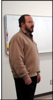
ボランティア 指導者