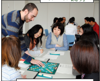
Let's do it again!

3月14日にスクラブル大会がありました。30人あまりが参加し、辞書を片手にゲームで盛り上がりました。