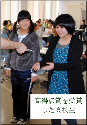
高得点賞を受賞 した高校生