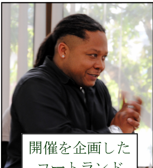
開催を企画した コートランド