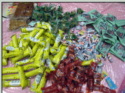
食文化を通しての国際交流